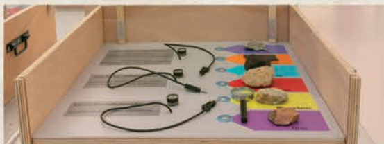
Observation et identification de roches