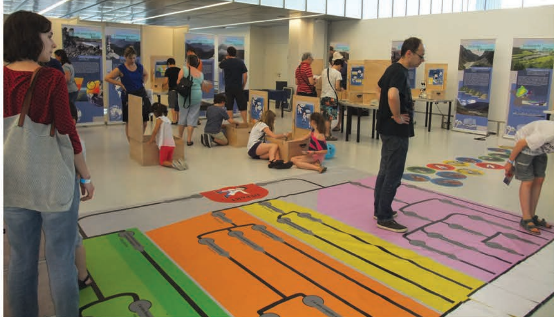
Réalisation de fouilles paléontologiques et reconstitution des paysages du passé. Jeu grandeur nature de la classification des fossiles.