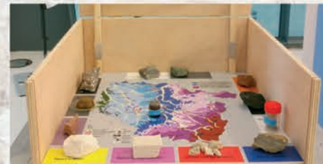
Découverte des ressources du sous-sol et de l'exploitation du sel, du charbon, du minerai de fer et des roches