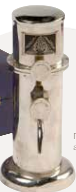
Fontaine au radium