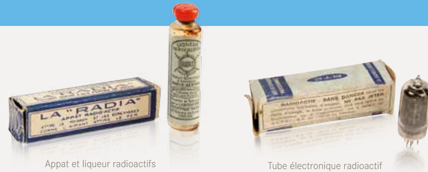
Appat et liqueur radioactifs