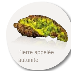
Pierre appelée autunite