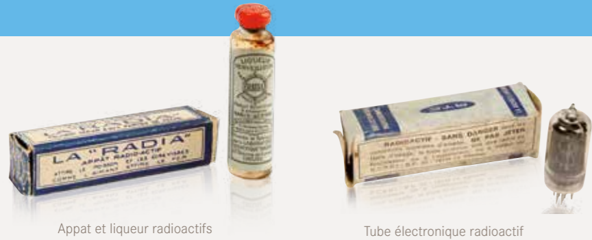
Appât et liqueur radioactifs