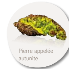
Pierre appelée autunite