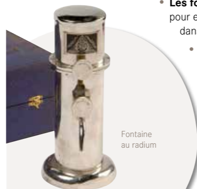
Fontaine au radium