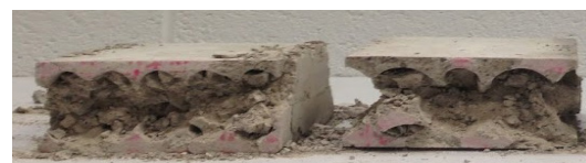
Essais mécaniques de compressibilité sur différents échantillons de variantes de blocs compressibles.